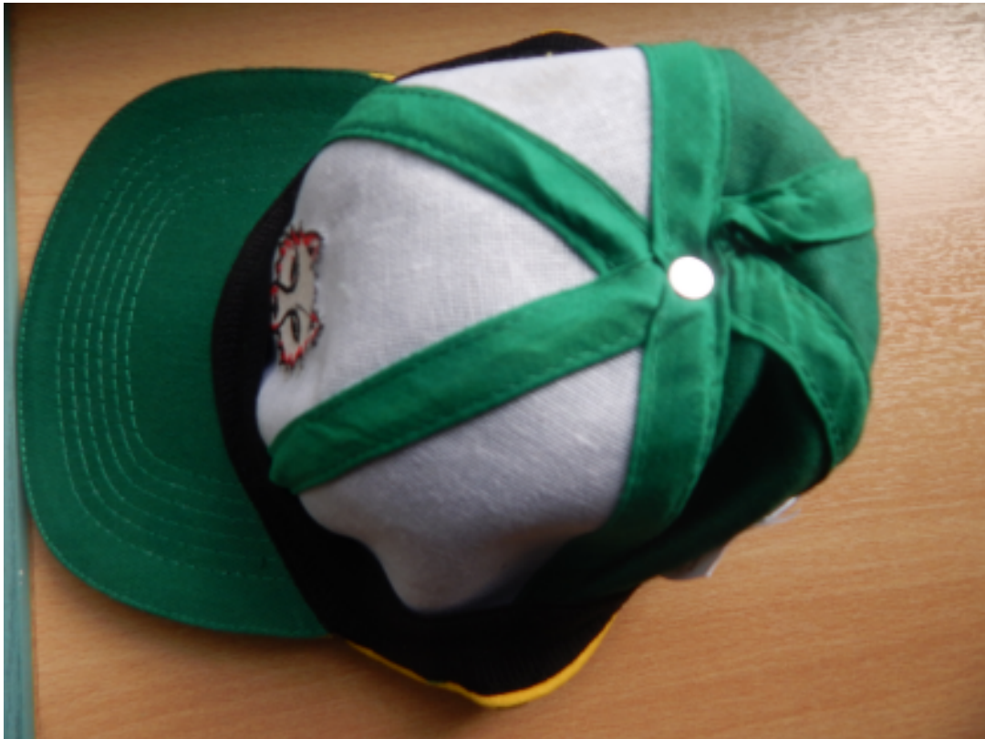
Κάλυψη εσωτερικών ραφών